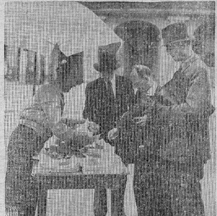
SE BURLO DE LOS ROJOS — Cuando los soviéticos le dijeron a este vendedor de periódicos que solamente podía aceptar marcos expedidos por los rojos, mudó su puesto al otro lado de la calle en la zona norteamericana de Berlín y ahora vende sus periódicos libremente y recibe marcos aliados.

El refrán está equivocado; debe decir: “más vale un pájaro volando que cien en mano”. “AMIGOS DE LA TIERRA”