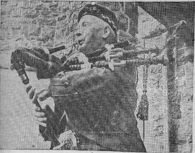
CELEBRA SU CUMPLEAÑOS — Sir Ha ry Leuder, famoso comediante escocés tocó esas flautas para celebrar su septuagésimo cumpleaños en su casa en Strathaven, Lanarkshire. Se negó a comentar el rumor de que iría a Hollywood en relación a la película de su vida que se filmará en la meca del cinematógrafo.