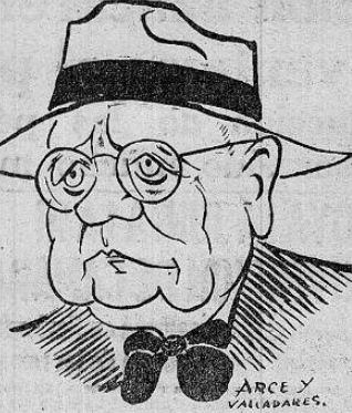
ARCE y VALADES.

Por su efectiva labor unificadora de los paises hermanos de Centro America