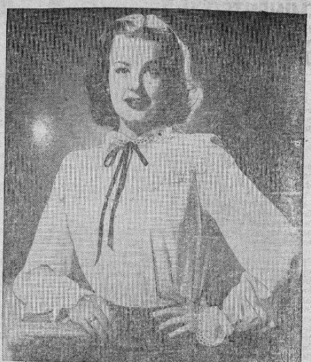
BELLISIMA — La bellisima artista Arle Dahl luce una blusa de crepé blanco con cuello y mangas de encaje. Además lleva una cinta negra que se amarra por el cuello.